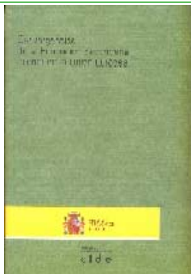
FERRER, F. (Coord.); NAYA, L.M.; y VALLE, J.M. (2004):

Los distintos capítulos desgranán desde las formas de acceso a la profesión docente, sus distintos escalones y grados, los distintos modelos de funcionamiento –la cátedra y el departamento– y su impacto en la promoción interna, hasta sus obligaciones y remuneraciones. Por último, Fauna académica incluye un capítulo, donde se analiza la situación española y se ponen de manifiesto aquellas particularidades que adquieren mayor relieve cuando se examinan a la luz del contexto europeo.