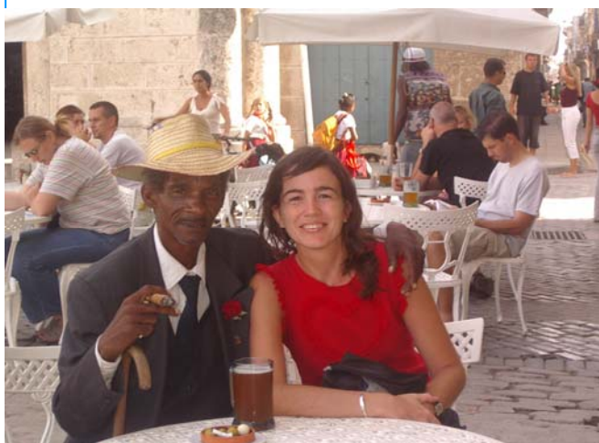
Redactora del Boletín recabando información en el entorno local del Congreso