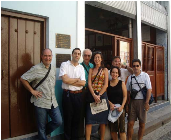
MIEMBROS DE LA SEEC EN EL XII CONGRESO MUNDIAL DE EDUCACIÓN COMPARADA DE LA WCCES (Abajo: ceremonia inaugural del congreso)