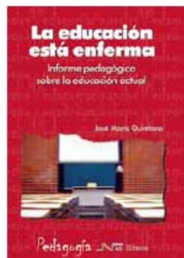
QUINTANA, JM (2004): La Educación está enferma .

El estudio que acaba de publicarse pretende, por un lado, conocer la situación y los proyectos de reforma de la educación secundaria inferior en los 15 países pertenecientes a la Unión Europea antes de la última ampliación. Por otra parte, intenta señalar las convergencias, divergencias y .../